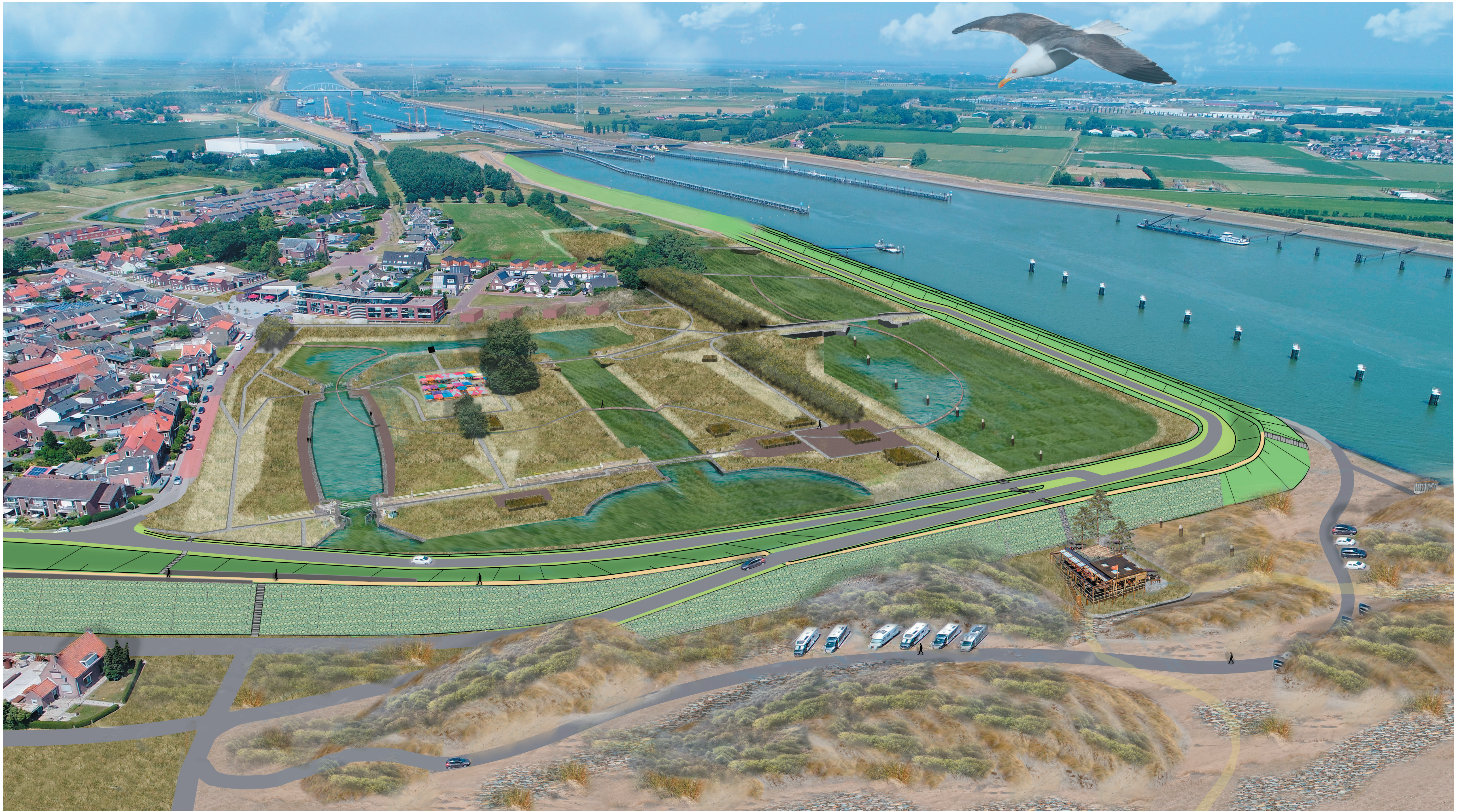
Zicht in noordelijke richting over het slibdepot en het historisch sluisencomplex